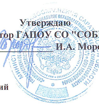
График проведения аккредитации специалистов в областном центре аккредитации и симуляционных технологий во 2 квартале 2024 года